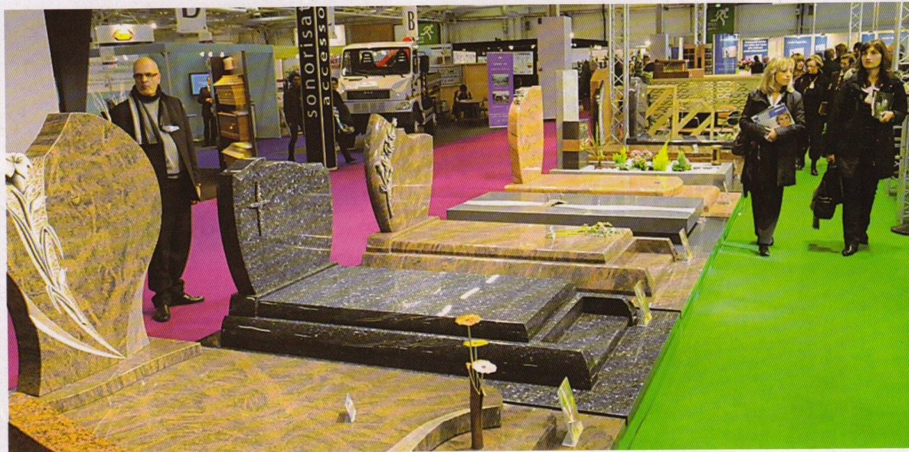
■ Ekspozycja pomników